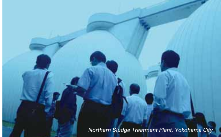
Northern Sludge Treatment Plant, Yokohama City